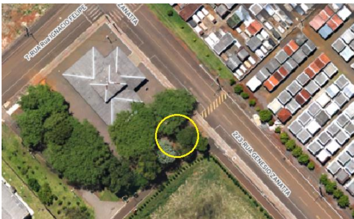
Figura 1: Localização do BWC Meu Campinho.

Será executado com uma área de 41,53m 2 , situado no lote CHÁCARA 1, na esquina das ruas Genesio Zanatta e Ignacio Felipe.